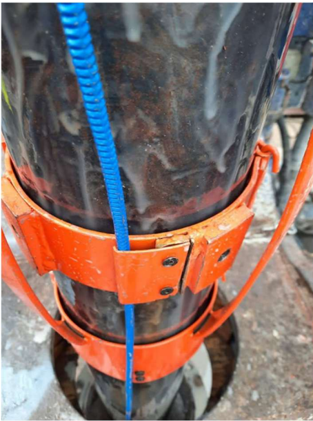
Abbildung 1: Centralizer zum Kabeleinbau

Dies ist ein anspruchsvoller Vorgang, da das Kabel im Vergleich zur tonnenschweren Stahl-Rohrtour des Einbaus vergleichsweise empfindlich ist. Das Kabel konnte so beschädigungsfrei in alle drei Bohrungen installiert werden.