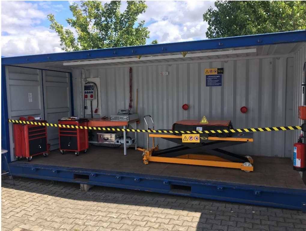
Abbildung 5: Entladecontainer für kritische Batterien

Ebenfalls wurde ein spezieller Prüfstand/Behandlungsstand zur elektrischen Entladung von gefährlichen oder beschädigten Lithium-Batterien in einem Seecontainer geschaffen.