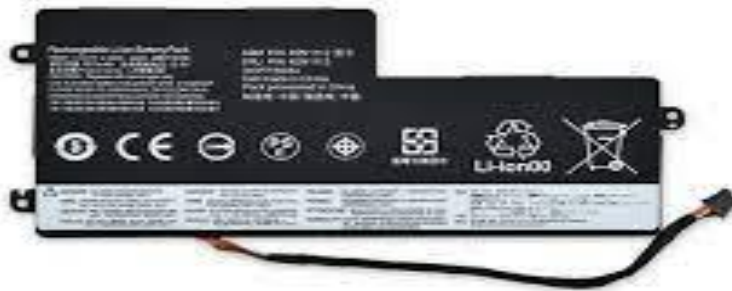
Abbildung 2: Beispiel interne Batterie