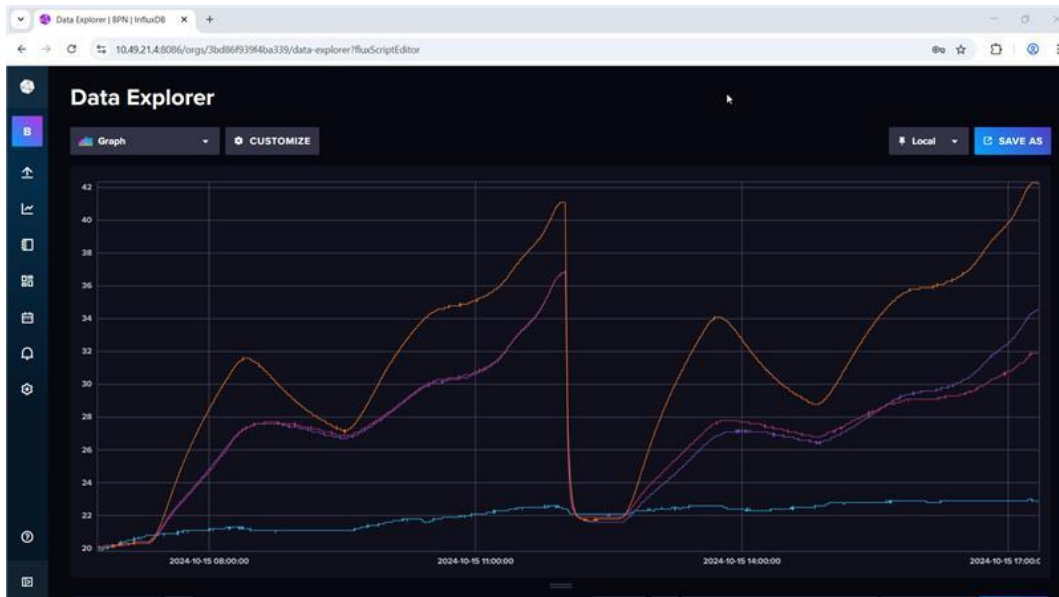
Abbildung 8: Temperaturkurve zur Messreihe Abb.7

anderen Graphen stellen den Temperaturanstieg während der Messung dar. Die hierfür benötigten Temperaturfühler sind um das Modul herum angeordnet.