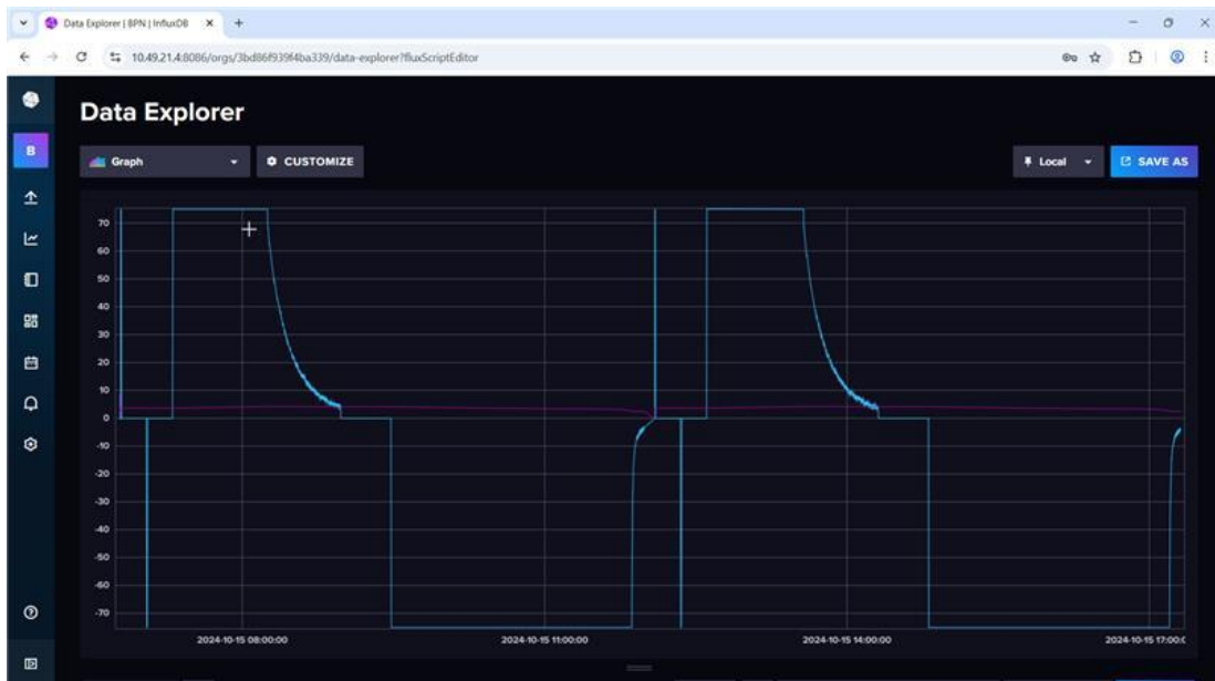
Abbildung 7: Darstellung aufeinanderfolgender Messungen

Insgesamt wurden 26 Module in 3 Hyundai Kona Batterien in Gänze vermessen. Messungen wurden auf Pack und Bricks-Ebene (parallele Zellen) durchgeführt.