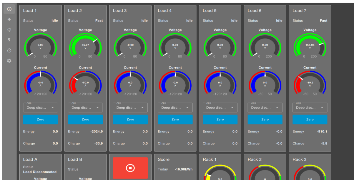
Abbildung 6: Exemplarische Darstellung Entladevorgang

Die Lade- und Entladezyklen der Batterien werden in einem Dashboard visualisiert um auch eine optische Kontrolle der Prozesse zu gewährleisten.