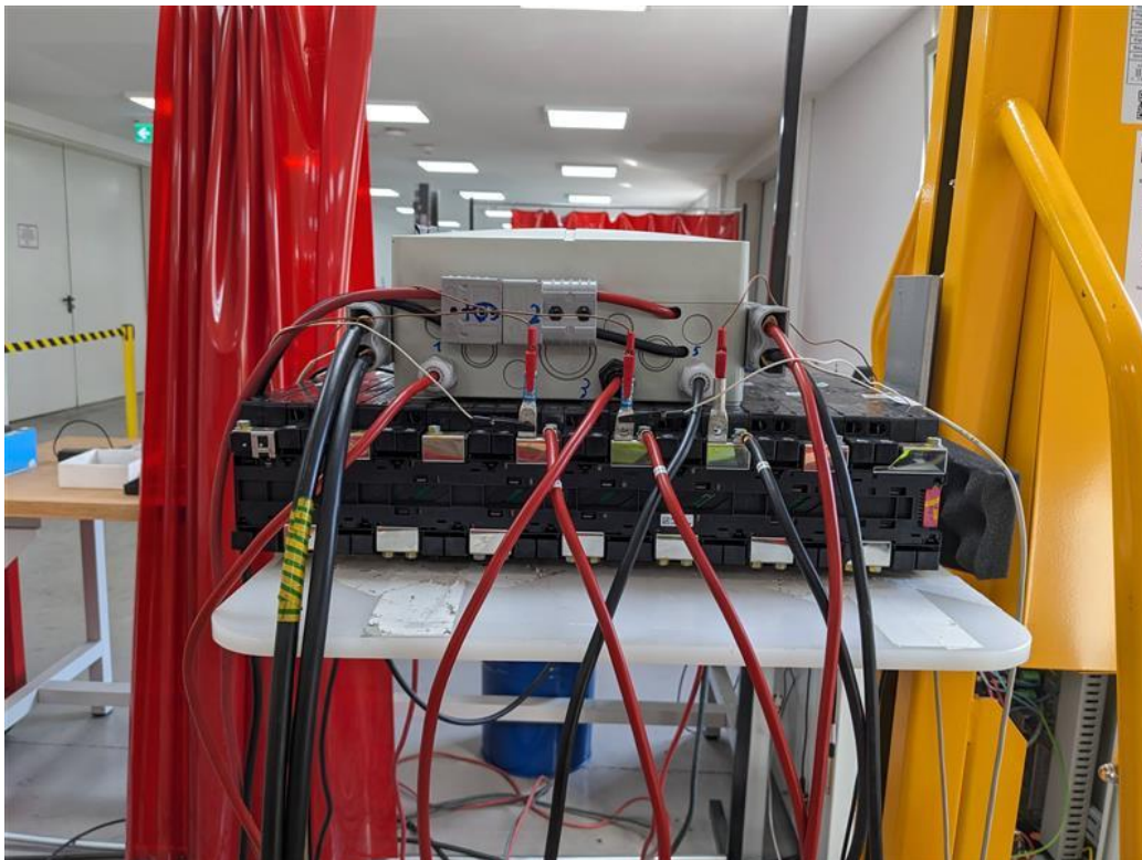
Abbildung 9: Versuchsaufbau - Testung Hyundai Kona Zellen

In nachfolgender Grafik ist ein exemplarischer Versuchsaufbau dargestellt, mit dem die Messungen durchgeführt wurden.