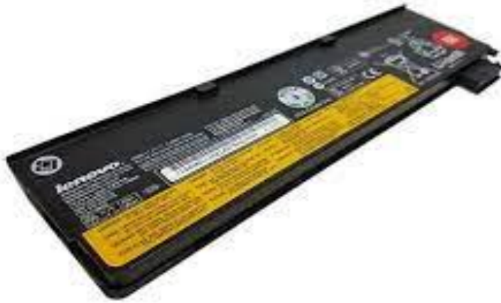
Abbildung 3: externe Batterie