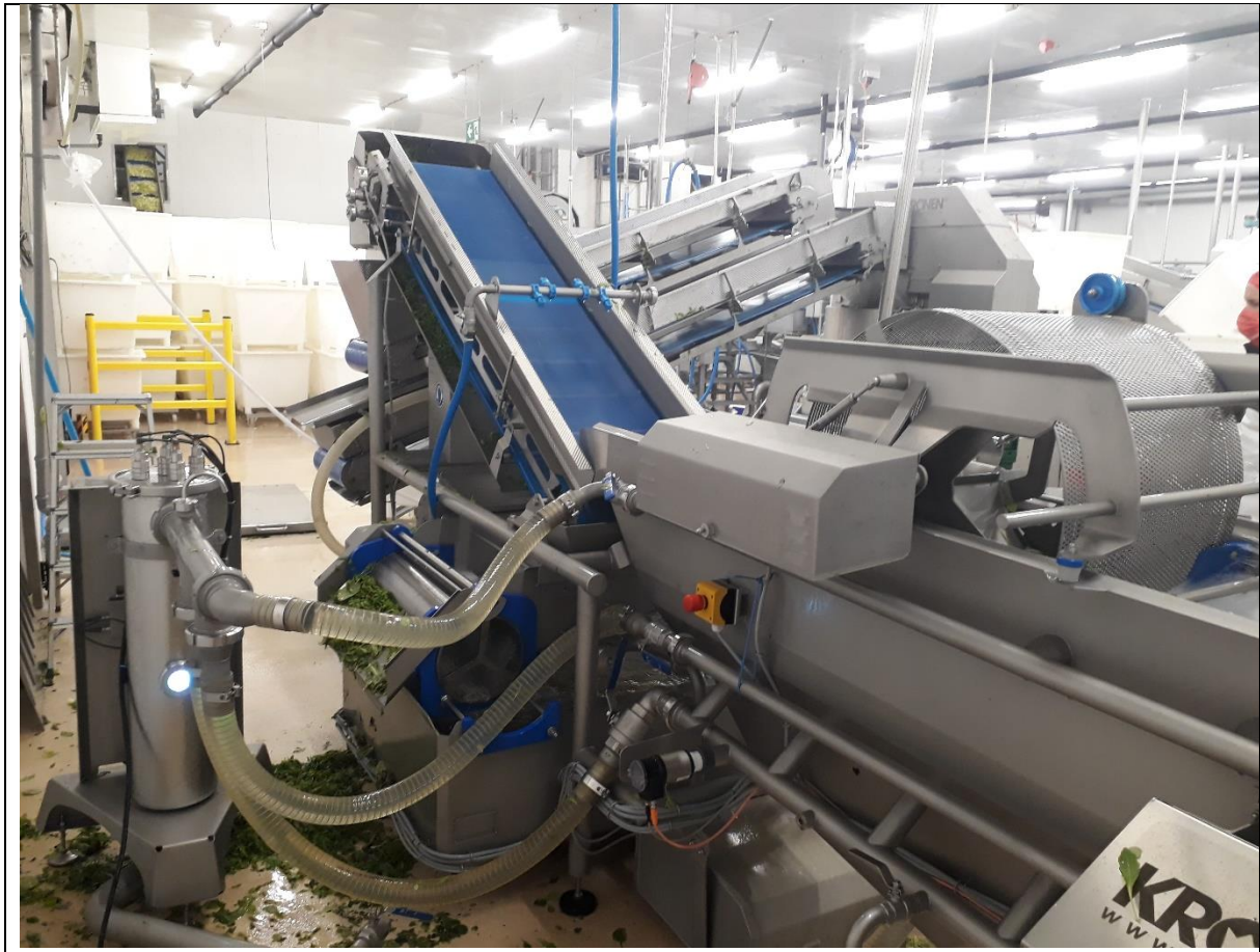
Abbildung 2: UV-C Anlage zur Aufbereitung des Waschwassers

von der Art der Flüssigkeit, ihrem Absorptionsvermögen, gelösten, kolloidalen oder suspendierten Stoffen abhängig, so dass die Strahlung in der Regel schon nach wenigen Millimetern vollständig absorbiert wird.