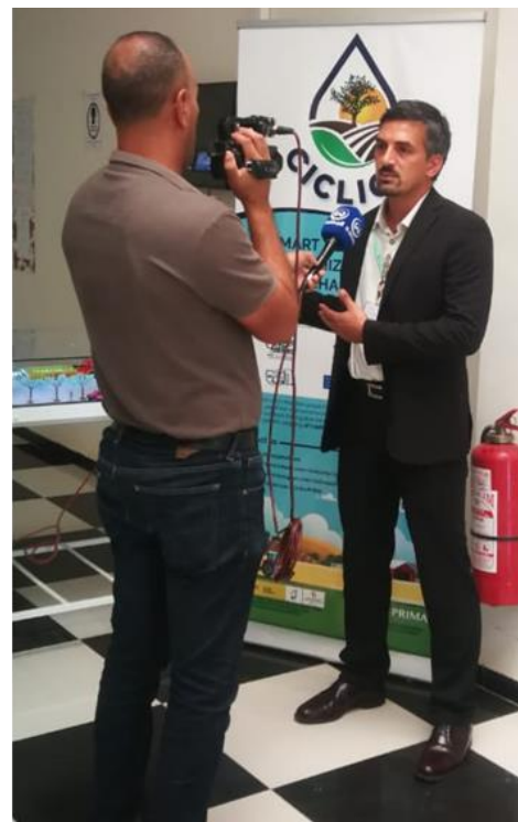
Abbildung 3: Fotos von der Dienstreise in Algerien