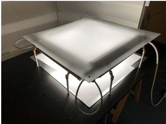
Abb. 4: Versuchsaufbau zur Austestung der besseren Lichthomogenität auf der lichtleitenden Fläche.

Einzelleuchten wurden abgewinkelt an den Rahmen befestigt und der optimale Abstrahlwinkel durch Lichtmessungen validiert. Der Montagerahmen wurde dafür neu konstruiert.