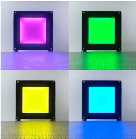
Abb. 2: Mit den vier regelbaren Kanälen können unterschiedliche Lichtregime erzeugt werden, um verschiedene Schadinsekten anzulocken.

Diese Lichtfarben zeigen eine physiologisch nachgewiesene Wirksamkeit auf Ziel-Insekten wie die Weiße Fliege und Thripse. Für die LED-Leuchttafel wurden vier verschiedene LED-Platinen entworfen, die jeweils unterschiedliche Effizienzen der LEDs berücksichtigen, um bei allen Lichtkanälen den gleichen Photonenfluss zu erzielen.