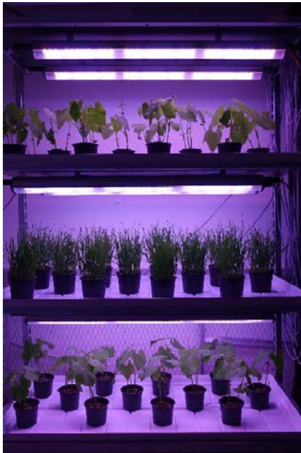
Abb. 5.: Eingestelltes Blaues, Rotes und weißes Licht in den getesteten Mehrlagenkulturanlagen zur Abschreckung der weißen Fliege, Foto LUH

Eine speziell konfigurierte Software ermöglicht die Steuerung der Leuchten über einen DALI-Controller, wobei jede Leuchte individuell adressierbar ist. Die konstruktiven Arbeiten wurden im Juni 2023 abgeschlossen und die LED-Leuchten waren seit ihrer Inbetriebnahme durch die Leibniz Universität Hannover (LUH) im Einsatz (Abb. 5).