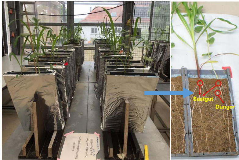
Abbildung 2: Rhizoboxen und Visualisierung der Düngerausbringung im Gemengeanbau (Unterfuß-Depotdüngung)

Die Ergebnisse zeigten, dass der Gemengeanbau keinen signifikanten Einfluss auf die Maisbiomasse und den P-Gehalt in den Struvit-Behandlungen hatte. Der handelsübliche mineralische P-Dünger (DAP) als Positivkontrolle verbesserte das Maiswachstum und die P-Aufnahme im Vergleich zur Struvit-Behandlung signifikant, allerdings nur im Gemengeanbau mit Leguminosen. Dies könnte auf die mögliche Konkurrenz zwischen zwei Maispflanzen in der Monokultur zurückzuführen sein.