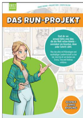
Abbildung 4: Titelseite RUN Science Comic

Das Ziel war, Bioökonomie-relevante Themen auch für ein jüngeres Publikum sichtbar zu machen und ein innovatives und niederschwelliges, didaktisch reduziertes Medium der Wissenschaftskommunikation zu realisieren. Bei Veranstaltungen erwies sich der Comic als Eye Catcher und fand viel Anklang. Mit ihm konnte ein erster Schritt zur Enttabuisierung des Themas Fäkalien erreicht und ein Impuls zum Umdenken im eigenen Konsumverhalten gegeben werden. Ein Hauptaugenmerk bei der Entwicklung des Comics wurde auf das Character Design gelegt, damit sich möglichst viele Leser/innen mit den Figuren und deren unterschiedlichen Perspektiven auf das Thema identifizieren können.