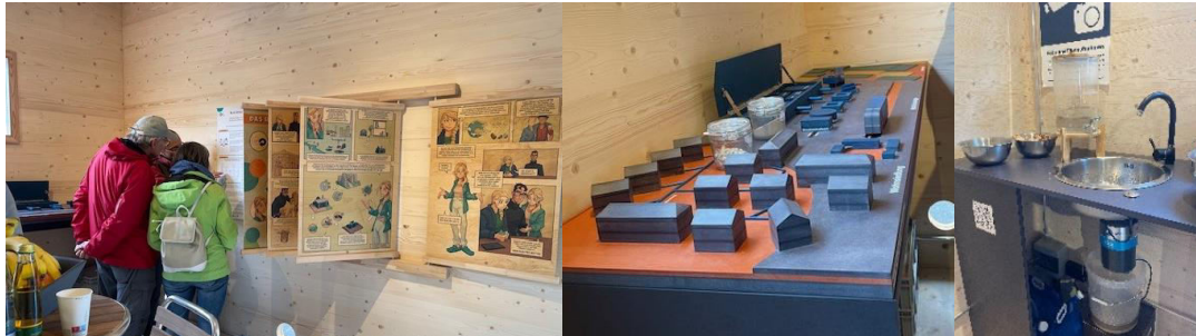
Abbildung 5: Innenraum des RUN Informations- und Erfahrungsraums

Der Raum wurde als demontier- und transportierbare mobile Version vorzugweise aus Naturmaterialien geplant. Er sollte auf der Größe einer ca. 30 m 2 großen 1-Zimmer-Wohnung in ein Alltagssetting eingebettet sein und die RUN-Technologie durch Demonstration an einer Küchenzeile erfahrbar machen. Der Bau und die Inbetriebnahme des Raums durchliefen zahlreiche planerische Herausforderungen (Standortwechsel der RUN-Pilotanlage, Mehrkosten von ca. 10 % durch den Ukrainekrieg, planerische Herausforderungen am temporären Standort der Universität Stuttgart, Produktionsausfälle). Er konnte dadurch erst am 17.04.2024 mit einem Opening-Event eröffnet werden.