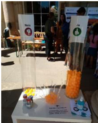
Abbildung 3: Interaktives Stimmungsbarometer am Tag der offenen Tür Universität Hohenheim

In den Jahren 2022, 2023 und 2024 war das Projekt RUN beim Tag der offenen Tür der Universität Hohenheim über einen Stand vertreten. Das GFE organisierte und betreute diesen Stand der Hohenheimer Agrarsysteme der Zukunft-Konsortien (NOcPS, GreenGrass und Onfield/ Fahrerkabine 4.0) federführend in Zusammenarbeit mit den Partner-Konsortien. Ein Interaktives Stimmungsbarometer diente am Tag der offenen Tür 2022 als sehr guter Gesprächsanreiz, um mit Besucher/innen in den Austausch über die RUN-Idee zu kommen. Sie konnten per Tischtennisball abstimmen, ob sie die Nahrungsmittel essen würden, die mit RUN-Dünger hergestellt wurden. Das Stimmungsbarometer fand viel Anklang: 275 Stimmen wurden insgesamt abgegeben, 93,5 % antworteten mit „Ja“. Im Jahr 2023 konnten Besucher/innen mit der virtuellen Brille der AdZ einen Rundgang durch alle Projekte der Förderlinie machen. Auch ein AdZ-Wimmelbild zum Ähren-Zählen (modifiziertes AdZ-Zukunftsbild), das von NOcPS zur Verfügung gestellt wurde, war gut geeignet, um in den Austausch über RUN und die anderen AdZ-Verbundvorhaben zu kommen. Die Tischtennisbälle des Stimmungsbarometers aus 2022 wurden 2023 für ein Bällebad-Quiz zu den Hohenheimer AdZ-Projekten umfunktioniert und zogen ebenfalls viele junge Besucher/innen an.