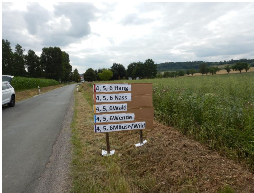
Abbildung A3: Für die Funktionaltests wurden Schilder am Straßenrand montiert. Jedes der Schilder ist mit fünf Befehlsketten bedruckt, von denen die rot, orange, gelb, blau und violett markierte zur 1., 2., 3., 4. und 5. Vorüberfahrt einer jeden Testperson zugeordnet ist.