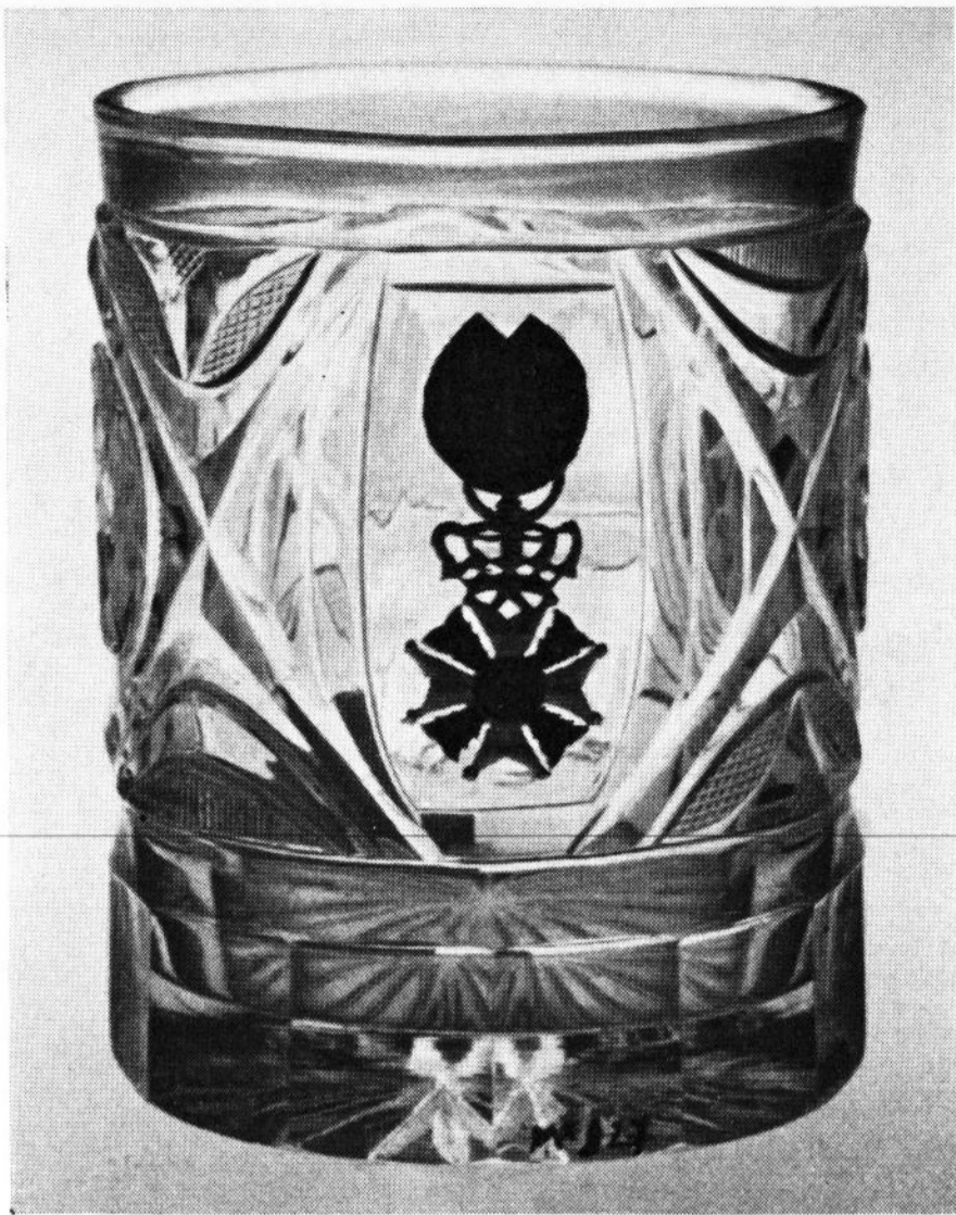
Bild 7. Becher. Verdienstkreuz WILHELM I. von Holland, Inkrustationstechnik, Emailmalerei auf Gold. Belgien, Vouèche um 1825. Lüttich, Musée Curtius (Inventar-Nr. Mx 927). Höhe 9,5 cm.

Außer diesen angeführten Ordensinsignien finden sich noch Darstellungen von folgenden Kongregationen: Deutscher Orden (1190 gestiftet), Michaels-Orden (1693 von JOSEPH CLEMENS Herzog von Bayern und Kurfürst von Köln gestiftet), Ernestinischer Hausorden (1683 von FRIEDRICH Herzog von Sachsen-Gotha gestiftet), Maria-Theresia-Verdienstorden (1757 von der habsburgischen Krone gegründet), St. Andreas-Orden (1698 durch Zar PETER den Großen von Rußland gestiftet), Malteser-Orden (1084 als Johanniter-Orden gegründet, seit 1530 im katholischen Zweig als Malteser-Orden geführt) und Christus-Orden (päpstlicher und portugiesischer Ritterorden, 1312 als Fortsetzung des Tempelherren-Ordens von DIONYSIUS, König von Portugal, weitergeführt).