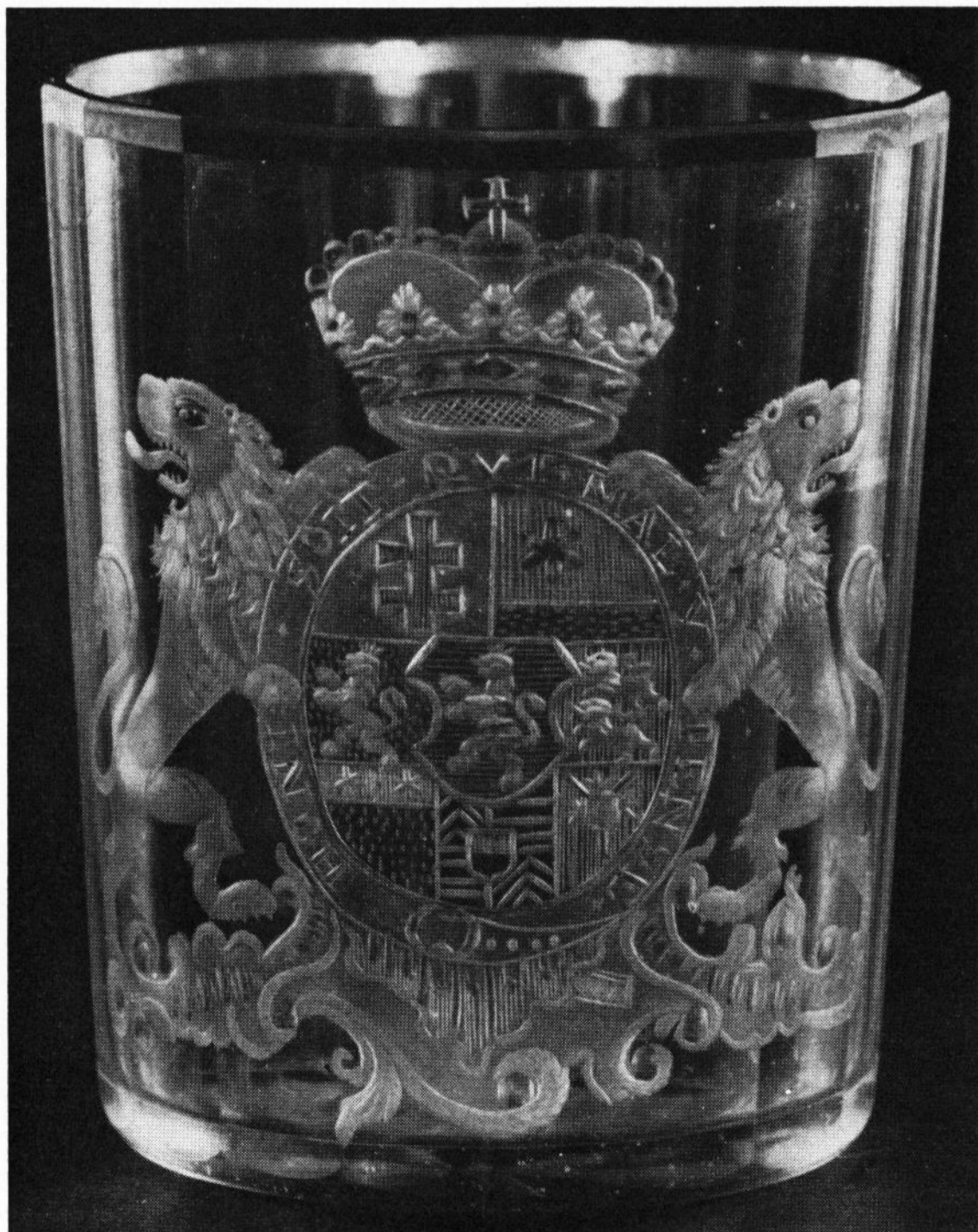
4) Bild 4. Becher mit Wappen von WILHELM IX. Landgraf von Hessen. Altmündener Hütte um 1786. Kassel, Staatliche Kunstsammlungen. Höhe 9 cm.