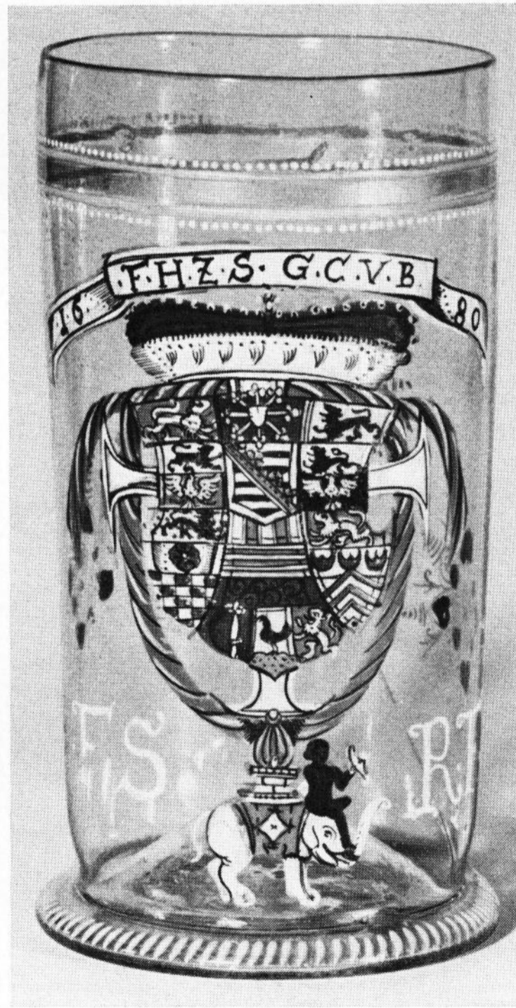
5) Bild 5. Hofkellereiglas. In Emailmalerei. Wappen und Monogramm von FRIEDRICH I. von Sachsen. Dresden, datiert 1680. Coburg, Kunstsammlungen der Veste Coburg (Inventar-Nr. a. S. 267). Höhe 17 cm.