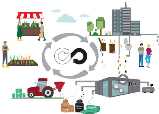
Abbildung 1 Regionaler Wertstoffkreislauf

Das Projektziel von RUN war die Schließung von Nähr- und Wertstoffkreisläufen zwischen regionalen Stadt- und Landschaftsräumen (Abbildung 1), um bereits auf dezentral-regionaler Ebene die Resilienz und Ressourceneffizienz von Agrarsystemen zu verbessern. Unter der Vorgabe bioökonomischer Prinzipien wurden konzeptionell-technische Lösungen für eine kleinräumige Partnerschaft zwischen Landwirt*innen und städtischen Bewohner*innen entwickelt. Das Vorhaben wurde von einem Konsortium bestehend aus Agrar- und Ingenieurwissenschaftlern, Soziologen, Systemanalytikern, Stadt- und Landschaftsplaner*innen, Ingenieur*innen und kommunalen Institutionen durchgeführt.