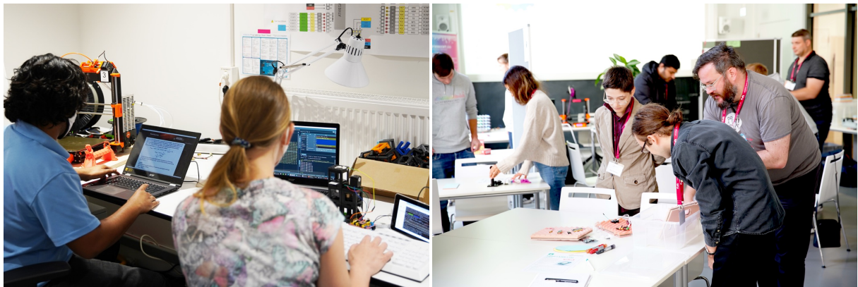
Abbildung 1: Beispielformate zur temporären Öffnung von Innovationsprozessen – Innovation Methods in Photonics 2021 sowie Photonics Days Makeathon 2022.

fand für alle drei F&E-Innovationsprojekte OffX, hi2 und Calisto insbesondere in der Innovation-Workshop-Reihe „Innovation Methods in Photonics“ (IMiP) statt. Dabei wurde die Öffnung des jeweiligen Innovationsprojektes für ein Team von Studierenden bzw. Forschenden mit Photonikbezug im Zeitraum von April bis September 2021 realisiert. Aufgrund der Pandemie konnten die Veranstaltungen nur online stattfinden. Dies hatte Konsequenzen sowohl für die didaktische Umsetzung als auch die Kommunikation und Interaktion mit und unter den Teilnehmenden. Auf Basis der guten Erfahrungen von 2021 wurden auch 2022 und 2023 wieder projektspezifische "Open Photonics Challenges" formuliert. Diese wurden vorwiegend über Workshops in den etablierten Formaten "Innovation Methods of Photonics" (April – September 2021, 2022 und 2023) sowie u.a. während dem Photonics Days Makeathon (Oktober 2022) für die Maker-Community geöffnet und bearbeitet. Durch diese temporären Öffnungen der individuellen Innovationsprozesse wurde eine zielgerichtete Einbindung externer Wissensträger in die Innovationsprojekte sichergestellt (s. Abb. 1).