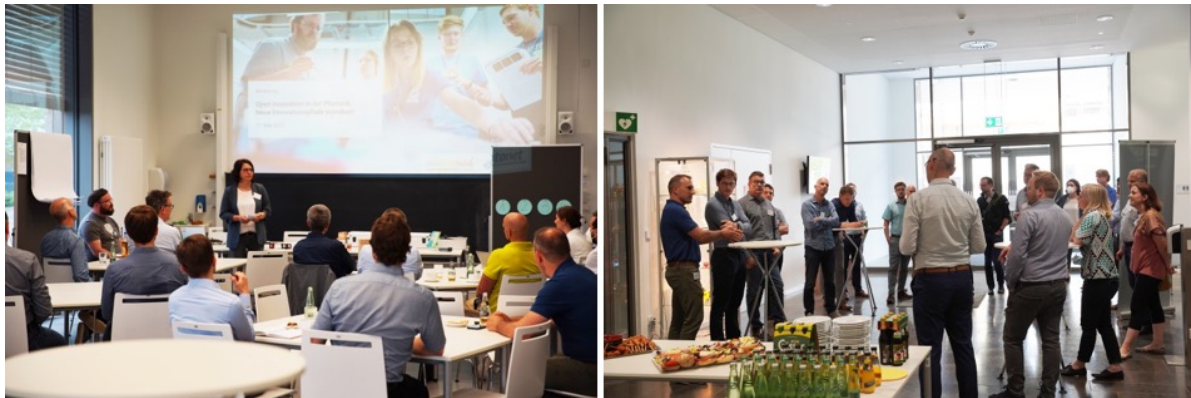
Abbildung 3: Impressionen vom Austausch mit Industrievertretern zum Thema "Open Innovation in der Photonik: Neue Innovationspfade erproben!" in Kooperation mit dem Branchenverband OptoNet e.V. (Mai 2022).

Meßtechnik GmbH, GÖPEL Electronic GmbH, siOPTICA GmbH, Günter-Köhler- Institut ifw GmbH, ams-OSRAM AG, LEONI Fiber Optics GmbH, Leistungselektronik Jena GmbH, JENOPTIK AG, Xsight Optics GmbH, openUC2 GmbH) durchgeführt (siehe Abbildung 3). Im nächsten Schritt wurden ausgewählte Unternehmen und Startups interviewt, um bessere Erkenntnisse über deren Open Innovation Prozess im Lichtwerkstatt Makerspace zu erhalten. Auf Basis dieser Daten konnten Erkenntnisse in Bezug auf die Gestaltung von Open Innovation Prozessen innerhalb der Photonik Branche unter Nutzung eines Makerspaces extrahiert werden.