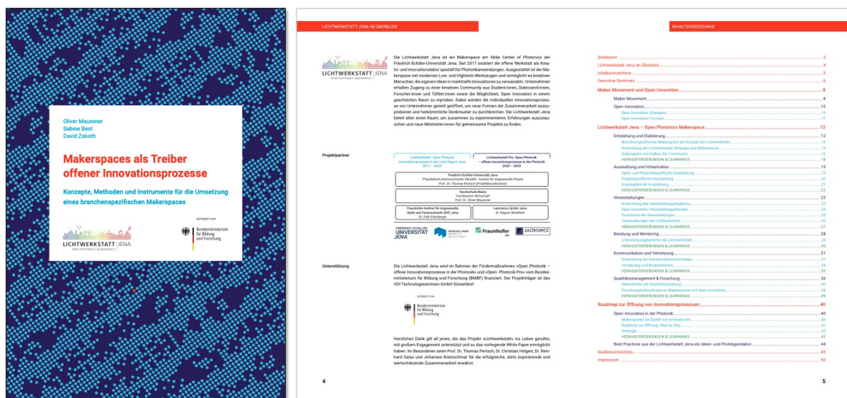
Abbildung 4: White Paper inklusive Industrial Open Photonics Guidelines.

Ein Großteil der Forschungs- und Projektergebnisse sind in Form eines Whitepapers veröffentlicht (siehe Abbildung 4) und stehen u.a. auf der Website des Lichtwerkstatt Makerspaces ( www.lichtwerkstatt-jena.de ) sowie der Digitalen Bibliothek Thüringen ( www.db-thueringen.de/receive/dbt_mods_00062120 ) für Interessierte aus Industrie und Forschung frei nutzbar zur Verfügung: