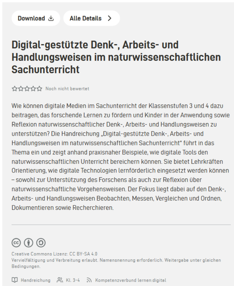
Abbildung 4: Ansicht Handreichung auf mundo.schule