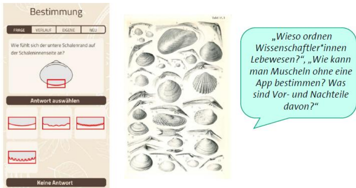
Abbildung 1: Lernumgebung: Vergleichen und Ordnen; Screenshot aus der App ID-Logics (li); Ausschnitt aus einem Bestimmungsbuch (Kuckuck, 1974) (re)

In einer ersten Pilotierung wurde eine digital-gestützte Lernumgebung mit Fokus auf den DAH „Vergleichen und Ordnen“, „Messen“ und „Dokumentieren“ in zwei Kleingruppen von Grundschüler*innen (N = 5; Übergang Klasse 4/5) erprobt. Dabei setzten sich die Kinder mit den Leitfragen auseinander: „Wieso ordnen Wissenschaftler*innen Lebewesen?“* und „Wie kann man Muscheln ohne eine App bestimmen? Was sind Vor- und Nachteile davon?“ (siehe Abb. 1). Zur Unterstützung nutzten die Schüler*innen sowohl die App ID-Logics als auch ein analoges Bestimmungsbuch (Kuckuck, 1974).