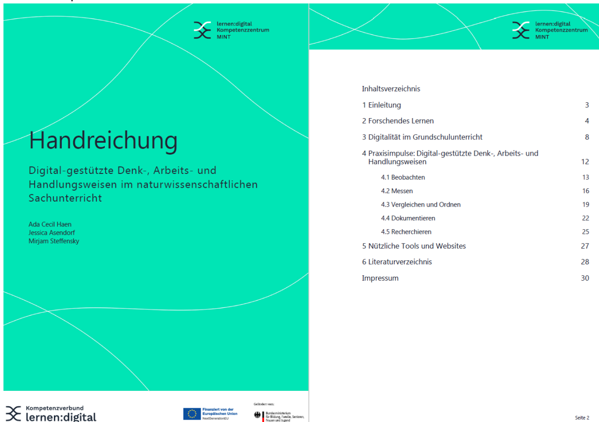
Abbildung 2: Inhaltsverzeichnis der Handreichung

Im Rahmen des Projekts DigiProMIN wurde am Standort Hamburg die Handreichung „Digital-gestützte Denk-, Arbeits- und Handlungsweisen im naturwissenschaftlichen Sachunterricht“ (Haen, Asendorf & Steffensky, 2025) entwickelt. Sie bildet das zentrale Transfer- und Ergebnisprodukt des Teilprojekts und richtet sich an Lehrkräfte des Sachunterrichts, die digitale Medien gezielt zur Förderung naturwissenschaftlicher DAH in der Grundschule einsetzen möchten. Die Handreichung verbindet wissenschaftliche Grundlagen zum Forschenden Lernen und Digitalität mit konkreten Praxisanregungen und stellt damit ein praxisnahes Bindeglied zwischen Forschung und Unterrichtspraxis dar.