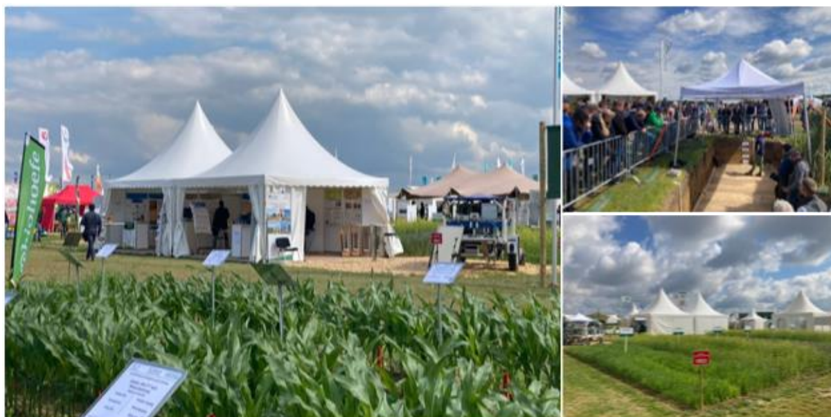
Abb. 1: BonaRes-Auftritt auf den DLG-Feldtagen 2024 in Erwitte Lippstadt

Im Berichtszeitraum präsentierte sich BonaRes mit dem BonaRes Zentrum und den Modul A-Projekten auf drei großen deutschen Messen (agra Messe in Leipzig, DLG Feldtage 2022 in Kirschgartshausen, DLG Feldtage 2024 in Erwitte-Lippstadt) (M1.3.7). Für die DLG Feldtage 2024 wurde ein 50 m 2 großer Stand zur Darstellung der zentralen Ergebnisse und Exponate aus dem BonaRes-Förderprogramm organisiert (Abb. 1). Zusätzlich wurden die Ergebnisse auf den DLG-Feldtagen in Fachforen präsentiert und mit Praktikern diskutiert, und Merkmale eines „guten Ackerbodens“ wurden gemeinsam mit Kollegen der Landwirtschaftskammer und dem Geologischen Dienst Nordrhein-Westfalen anhand eines sehr gut besuchten Bodenprofils vorgestellt. Weiterhin haben die Partner der TUM Bohrkerne und Wissen zur Kohlenstoffspeicherung für einen BMUV-Stand zur Aktionsplattform Natürlicher Klimaschutz auf der Internationalen Grünen Woche (Januar 2023) in Berlin beigesteuert.